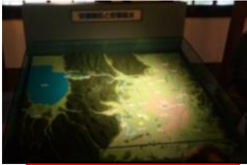
不毛の地に恵みをもたらす 安積疏水のジオラマ