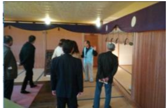
天皇陛下が宿泊された部屋